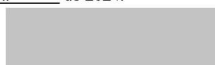
Assessora – Unidade Resende AGEVAP