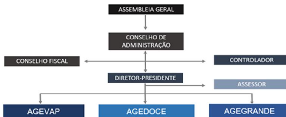
Figura 01 – Organograma AGEVAP.

A sede da AGEVAP está localizada em Resende/RJ. A Agência possui 10 (dez) Unidades Descentralizadas (UDs) localizadas nos municípios de Volta Redonda, Petrópolis, Nova Friburgo, Campos dos Goytacazes, Seropédica, Rio de Janeiro, Angra dos Reis (localizadas no estado do Rio de Janeiro), Juiz de Fora, Guarani