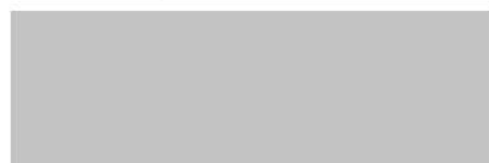
Assessora – Unidade Resende AGEVAP